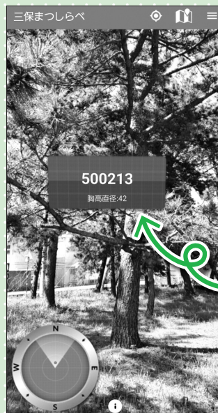
▲カメラモード (AR機能付き) 倒木を見つけたら撮影し報告します

◀アプリには、全3万本の松のデータベース (位置、胸高直径、樹高等) が入っています。自分が見守りたいお気に入りの松にニックネームを登録することもできます♪